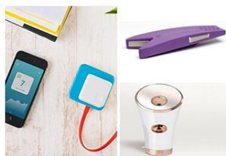
Beauté connectée : 3 objets qui vont révolutionner votre quotidien